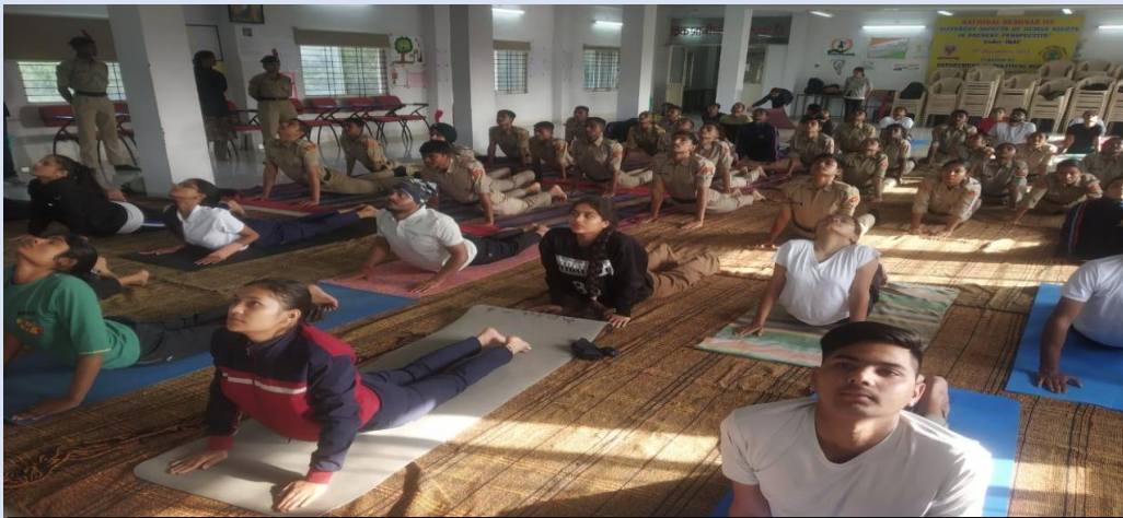
फोटो- सामूहिक सूर्य नमस्कार करते महाविद्यालय के विद्यार्थी।