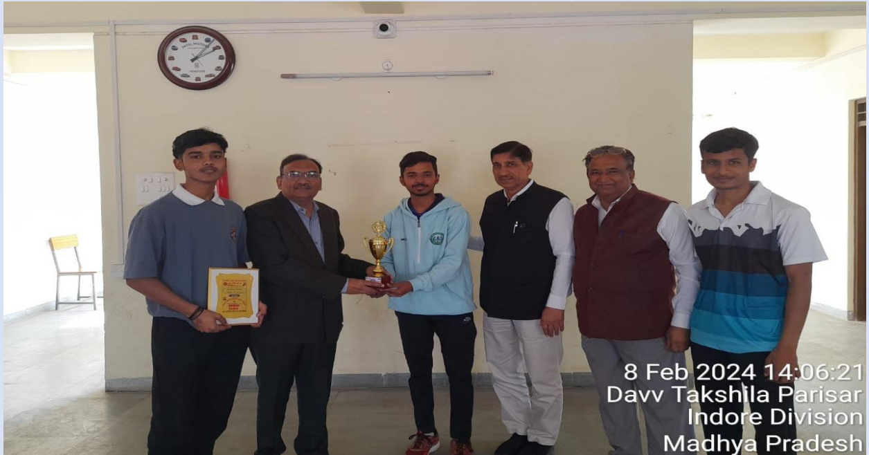
8 Feb 2024 14:06:21 Davv Takshila Parisar Indore Division Madhya Pradesh